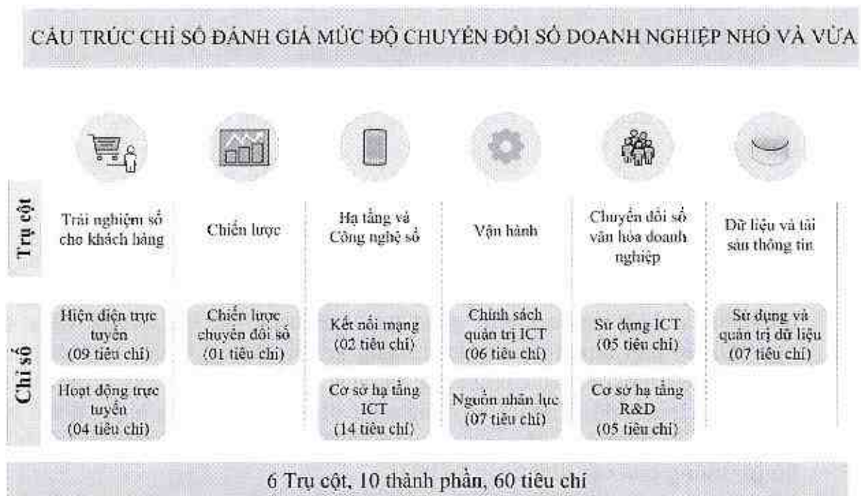
Hình 1. Cấu trúc Chỉ số đánh giá mức độ chuyển đổi số doanh nghiệp nhỏ và vừa

Trong mỗi trụ cột có các chỉ số thành phần, trong mỗi chỉ số thành phần có các tiêu chí (10 chỉ số thành phần và 60 tiêu chí). Sơ đồ cấu trúc Chỉ số đánh giá mức độ chuyển đổi số doanh nghiệp nhỏ và vừa được mô tả như Hình 1.